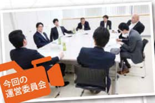
今回の運営委員会