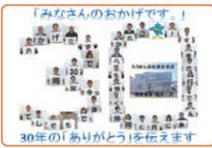
「みなさんのおかげです。」 30年の「ありがとう」を伝えます

高橋/2016年度に開設30周年を迎えた浜松高台支店の運営委員会は、地域の事業目標達成に向けた運動を力強く推し進めました。運営委員会活動や自組織の(ろうきん)運動推進に積極的に携わっていただくため、グループ討議の充実を図るとともに、「知らせる活動」としてSSL作戦、運営委員の知識向上を目的としたミニセミナー&チェックテストの実施等、他店にない特徴的な取り組みを通して常に運営委員会会員のレベル向上を図っています。